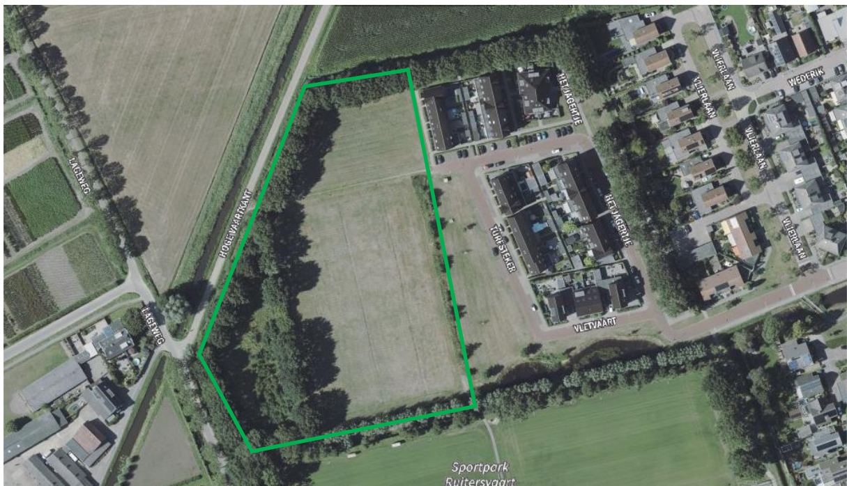
Afbeelding 1: ligging E-veld

Het E-veld werd in het verleden als trainingsveld door de plaatselijk sportvereniging gebruikt maar is als zodanig al een aantal jaren niet meer in gebruik. De locatie, hoofdzakelijk bestaand grasland, is circa 1,8 hectare groot en wordt grotendeels door stevige bomenrijen omzoomd. Aan de noord- en westzijde wordt het E-veld door het (open) agrarische gebied begrensd. Aan de oostzijde grenst een woonwijkje dat in 2010 op het voormalige F-veld is gebouwd. Ten zuiden van de locatie liggen sportvelden.