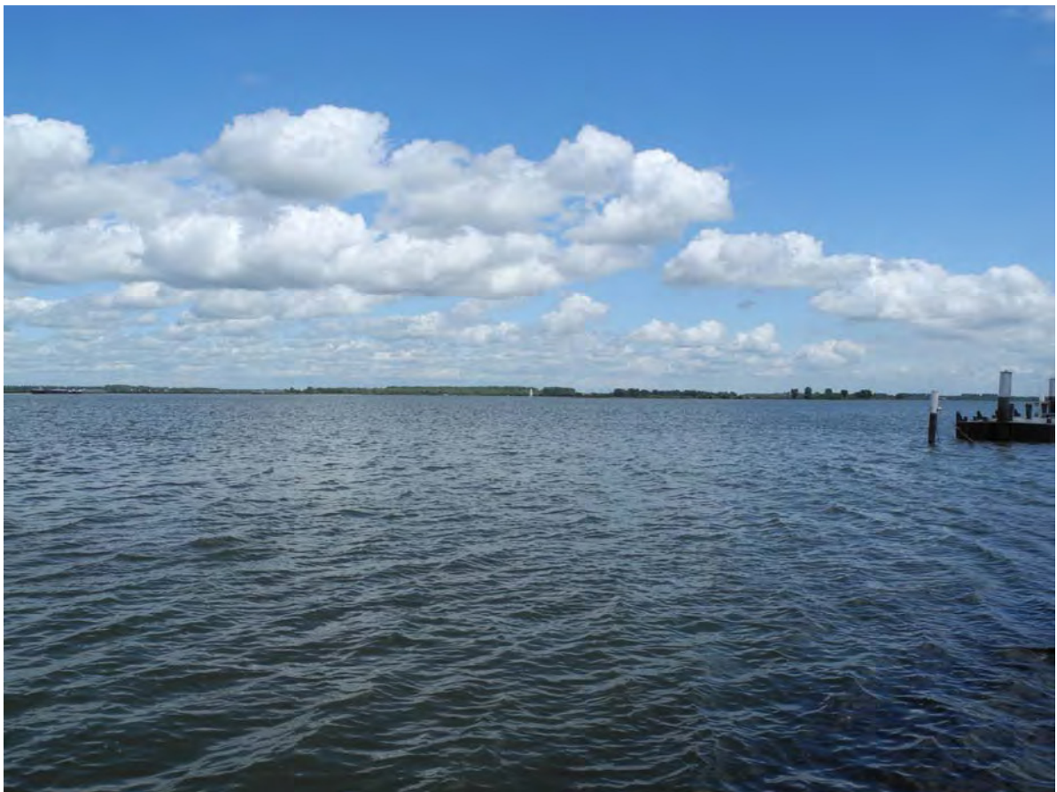
Afbeelding 2: de gemeente Drimmelen beschikt met de Biesbosch over een echte parel van archeologisch erfgoed. Het verdrongen landschap dat onder de waterspiegel ligt, herbergt nog menig onaangeroerde archeologische vindplaats.

In de gemeente Drimmelen is de aanwezigheid van archeologische resten in het verleden niet altijd even evident geweest. Toch hebben de kernen binnen de gemeentegrenzen meer dan voldoende van hun eigen historie te beleven en te koesteren. In Terheijden staat bijvoorbeeld nog een complete schans uit de tachtigjarige oorlog boven maaiveld en Made heeft bij archeologisch onderzoek in de afgelopen tien jaar meermalen laten zien dat het in het verleden en tegenwoordig goed toeveen was in deze plaats. En zo zijn voor de andere kernen, soms met wat speurwerk, eveneens de archeologische restanten van het verleden minder ver weg dan dat je zou denken.