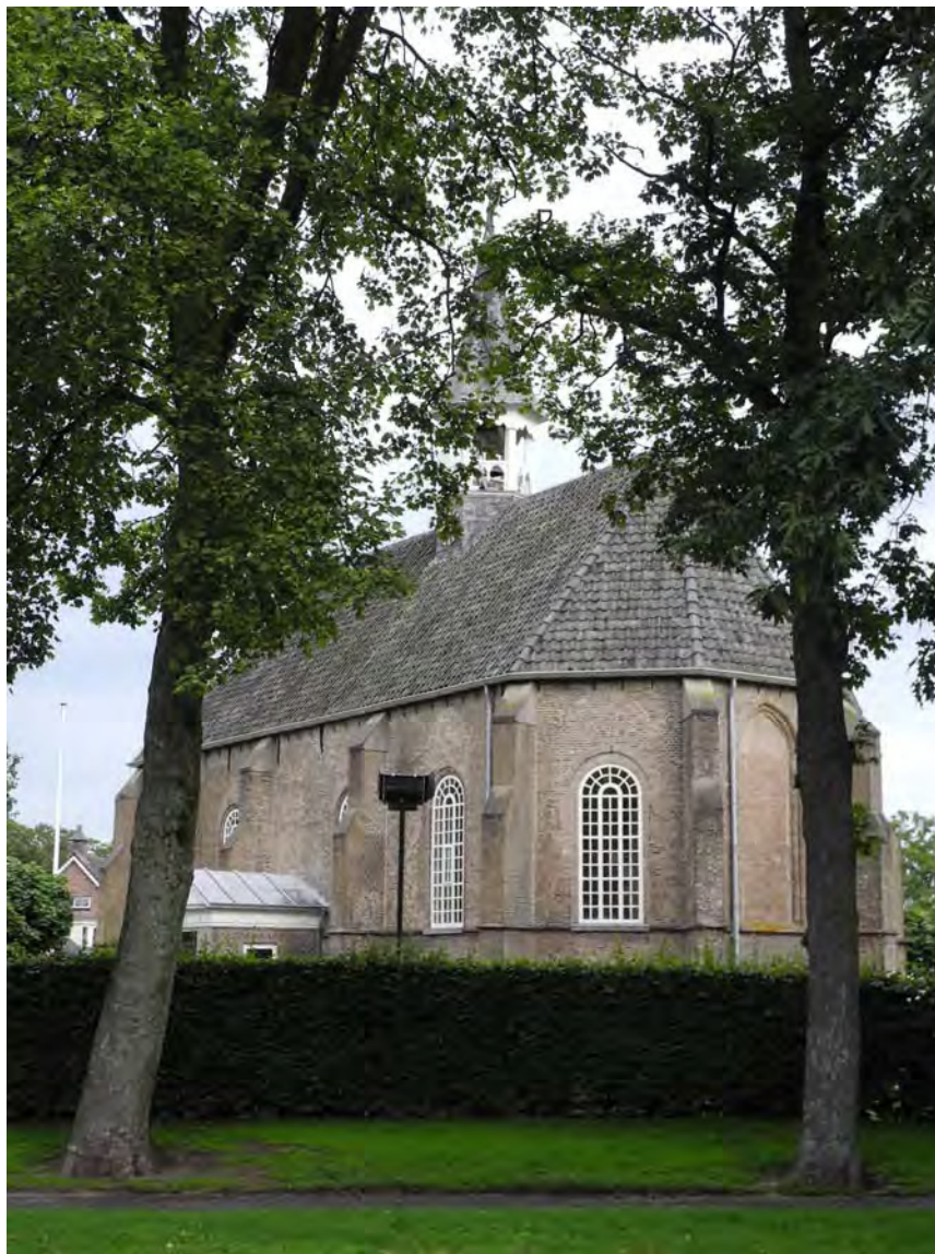
Afbeelding 3: oorspronkelijk was Made het landbouwgebied van de laatmiddeleeuwse stad Geertruidenberg. Bij het loslaten van deze verhoudingen werd het kerkgebouw van Made een eigen parochieel centrum waar men in het eigen dorp ter kerke kon gaan.